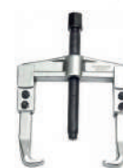
Съемник шестерен двухзахватный 200X150мм, Forsage