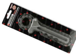
Съемник масляного фильтра цепной (Ш110мм), в блистере Forsage