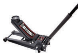
Домкрат гидравл подк. 3т двухпорш. низкопроф. 75-510мм FORCEKRAFT