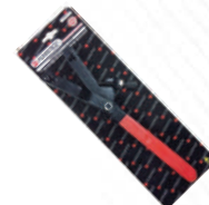
Фиксатор шкива универсальный (36-110мм) на блистере Forsage