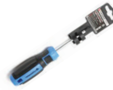
Отвертки крестовые PH Forsage в ассортименте