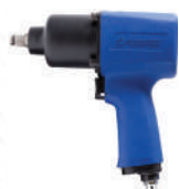
Гайковерт пневматический ударный Forsage 1/2"DR, 1492Nm