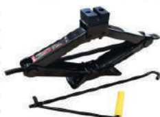
Домкрат винтовой ромб 2т 110-395мм PATRON в сумке