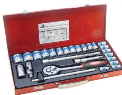
Набор инструмента 24 предметов 1/2" DR, 6гр.(8-32мм), в металлическом кейсе KINGTUL profi