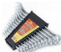
Набор ключей комб-х в холдере KINGTUL 12предм 8-24мм