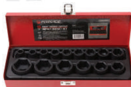
Набор головок ударных 1/2"DR, 15 пр. (10-32мм) 6гр. в мет. кейсе Forsage