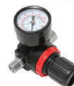
Регулятор давления воздуха с индикатором 1/4"(F)x1/4"(M)