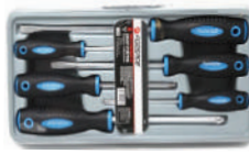
Набор отверток шлиц + крест 6 пр в футляре, Forsage