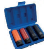
Набор головок ударных тонкостенных 1/2"DR, 4 пр.(17-19мм) Forsage