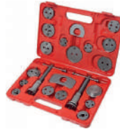
Набор для возврата тормозных цилиндров, 21 пр. PARTNER