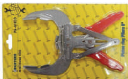
Щипцы для поршневых колец, 80-120мм PARTNER