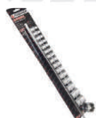
Набор головок 16 пр. 1/2"DR, 6гр. 10-32мм. на держ. Forsage