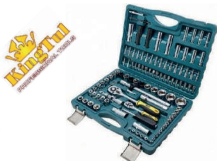
Набор инструмента 82, 94, 108 предметов KINGTUL 6 граней 1/4, 1/2" DR