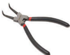
Съемник стопорных колец гнутой на сжим (90°, L-150мм) Partner