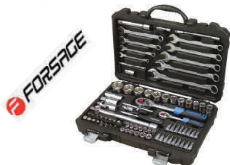
Набор инструмента 82, 94, 108, 142, 216 предметов Forsage, 6 граней 1/4, 1/2" DR