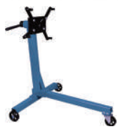
Кантователь двигателя складной 340кг, Forsage