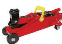
Домкрат гидравл подкат 2т 135-320мм PATRON в кейсе