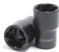
Головка экстрактор для повреждённых болтов/гаек 19мм*50мм 1/2" FORSAGE