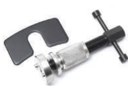
Приспособление для возврата тормозных цилиндров 2 предм, Partner