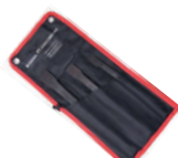
Набор зубил, 3пр. (18x175, 26x200, 29x250мм), на полотне Forsage