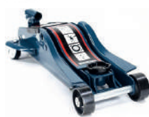
Домкрат гидравл подкат 3т 85-387мм Forsage