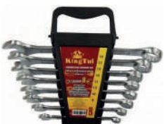
Набор ключей комб-х в холдере KINGTUL 8предм. 8-19мм