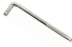
Вороток Г-образный 1/4"DR Forsage в ассортименте