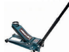
Домкрат гидравл подк 3т двухпорш. низкопроф. 75-510мм Forsage