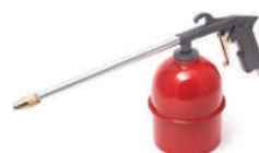
Пневмопистолет для мойки двигателя