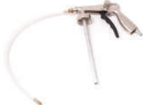
Пневмопистолет для гравитекса с распылителем, Partner