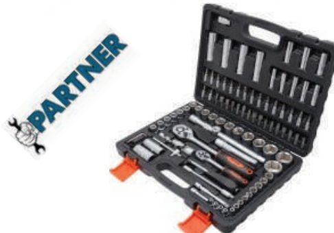
Набор инструмента 82, 94, 108, 172 предметов Partner 6 граней 1/4, 1/2" DR