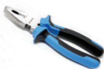
Пассатижи 150мм, в блистере Forsage