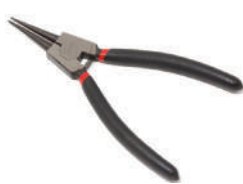
Съемник стопорных колец прямой на разжим (L-150мм) Partner