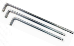
Воротки Г-образные 1/2"DR Forsage в ассортименте