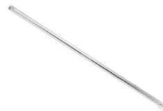
Удлинители 1/2" Forsage в ассортименте