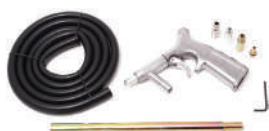
Пневмопистолет пескоструйный на блистере (4 сменных сопла) Partner