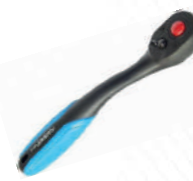
Трещотка 1/2" 72 зуба. в облегченном корпусе, Forsage