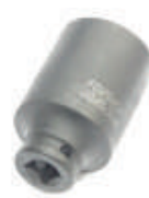
Головки ударные глубокие тонкостенные 1/2" 6гр. Forsage в ассортименте