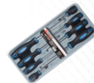
Набор отверток шлиц + крест 8 пр в футляре, Forsage