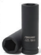
Головки ударные глубокие 1/2" 6гр. Forsage в ассортименте