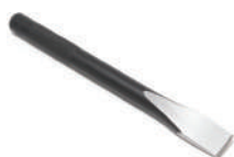
Зубило с 6-гр. основанием 13мм (L=150мм) Forsage