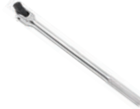
Воротки шарнирные 1/2"DR с накаткой Forsage в ассортименте