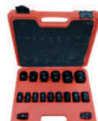
Набор головок ударных 1/2"DR, 17 пр. (10-36мм) в пласт. кейсе PARTNER