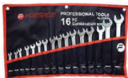
Набор ключей комб-х в сумке Forsage 16 предм 6-24мм